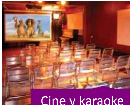
Cine y karaoke